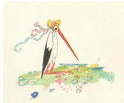
Illustrations de Lorioux.

En vous aidant des exemples précédents, inventez deux phrases à la voix active et deux phrases à la voix passive. Vous pouvez, si vous le voulez, exprimer le complément d'agent dans les phrases passives.